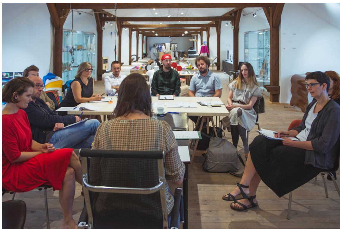
Stretnutie členov medzinárodnej poroty NCD 2017

Prihlasovanie do súťaže sa konalo výlučne online formou, pričom prihlásených bolo až 176 prác . Členovia odbornej poroty sa stretli 26. júla, aby posúdili súťažné práce a rozhodli o postúpení prác na výstavu finalistov a o udelení cien v jednotlivých kategóriách. Diela finalistov budú prezentované na výstave v Galérii v podkroví Slovenského múzea dizajnu v Hurbanových kasárňach v Bratislave od 27. septembra do 30. novembra 2017. Slávnostné vyhlásenie výsledkov sa uskutoční 13. októbra 2017 v priestoroch tzv. novej Cvernovky.