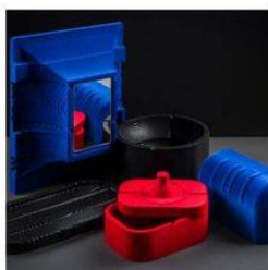
SILVIA SUKOPOVA SUKOPOVA.COM