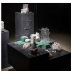
OLEKSANDRA BAKUSHINA INSTAGRAM.COM/EFROSINIASAVSKYA