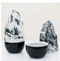
LUCIA KOVACIKOVA LUCIAKOVACIKOVA.COM