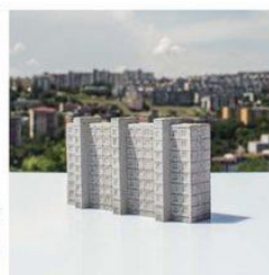
BETON EXPORT BETONEXPORT.SK