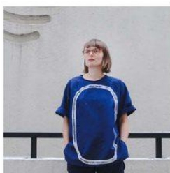
BY-PRODUCTS & STUKART INSTAGRAM.COM/BY__PRODUCTS