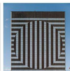
LOUSY AUBER INSTAGRAM.COM/LOUSYAUBER