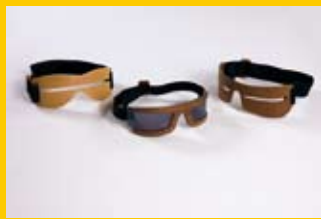
Marián Vaňo / VŠVU / Ateliér produkt dizajn / 6.roč. / OIO masky