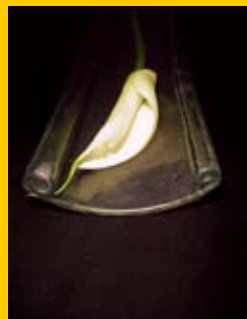
Daša Patková / STU FA / Dizajn výrobkov / 3.roč. / Scroll Baowl, Cozmos, Wrinkly