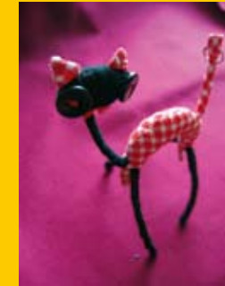
Zuzana Koňáková / STU FA / Dizajn výrobkov / 4.roč. / Privesky na kľúče