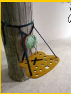
Katarína Komárová / VŠVU / Ateliér industrial dizajn / 2.roč. / Oddychové sedenie