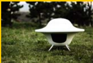
Milan Kupča / VŠVU / Ateliér produkt dizajn / 3.roč. / UFO / Prístrešok pre zvierata