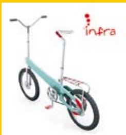
Barbora Tobolová / STU FA / Dizajn výrobkov / 6.roč. / Bicykel