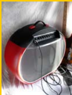
Ján Štofko / STU FA / Dizajn výrobkov / 5.roč. / Gitarový zosilovač