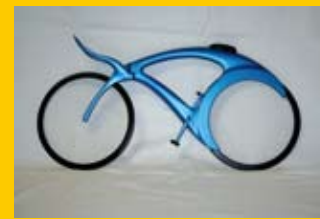
Petra Arendášová / STU FA / Dizajn výrobkov / 5.roč. / Kiwi bicykel