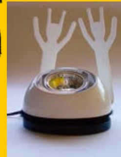
Tamara Belešová / VŠVU / Ateliér produkt dizajn / 3.roč. / Spomienky na budúcnosť